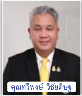
คุณทวีพงษ์ วิชัยดิษฐ

ขอแสดงความยินดีกับ คุณทวีพงษ์ วิชัยดิษฐ ผู้ว่าการเคหะแห่งชาติ ที่ได้รับรางวัลข้าราชการดีเด่นแห่งชาติ ประจำปี พ.ศ.2564 สาขาข้าราชการพลเรือนตัวอย่างดีเด่น จากโครงการธรรมาภิบาลแห่งชาติ และยังได้รับ รางวัลสิงห์เข็มทอง (นักบริหารดีเด่น) ประจำปี พ.ศ.2564 ครั้งที่ 5 สาขาผู้บริหารองค์กรดีเด่น ด้านส่งเสริมและพัฒนาบริหารองค์กร (ภาครัฐ) จาก สมาพันธ์สื่อสารมวลชนแห่งประเทศไทย