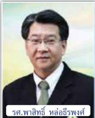
รศ.พาลีทิพย์ หล่อธีรพงศ์

ขอแสดงความยินดีกับลูกช้างจากคณะวิศวกรรมศาสตร์ ได้แก่ รศ.พาลีทิพย์ หล่อธีรพงศ์ ที่ได้รับแต่งตั้งเป็น รองปลัดกระทรวงการอุดมศึกษา วิทยาศาสตร์ วิจัยและนวัตกรรม