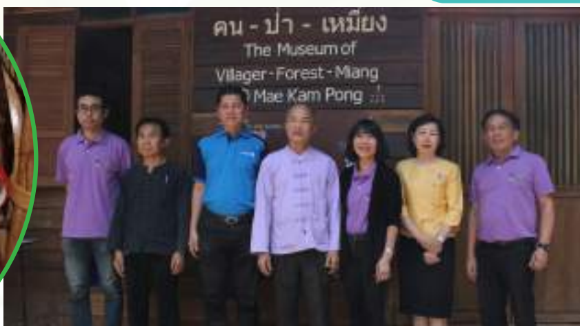
การลงพื้นที่ร่วมกันของนักวิชาการในสาขาต่าง ๆ ที่ชุมชน “คน-ป่า-เหมี้ยง”

คอนเซ็ปต์ของ ‘คน-ป่า-เหมี้ยง’ คือการอาศัยและพึ่งพากันอย่างเป็นระบบของคน ป่าและต้นชาเหมี้ยงที่ต้องปลูกภายใต้ร่มเงาของป่า กลายเป็นวิถีชีวิตและภูมิปัญญาที่สำคัญยิ่งของคนล้านนา ที่ก่อให้เกิดความยั่งยืนตามมา คือ ป่ายังอยู่ น้ำยังอยู่ และคนก็ยังมีชีวิตอยู่ได้ โดยโครงการนี้จะมีนักวิจัยที่ชำนาญในหลายศาสตร์ที่มีมุมมองที่ต่างกันไป ทำการวิจัยแบบบูรณาการ นำองค์ความรู้ในแต่ละศาสตร์ที่แตกต่างมาเชื่อมโยงให้เกิดประโยชน์ โดยมีเป้าหมายเพื่อค้นหาข้อเท็จจริงที่เป็นธรรมชาติและองค์ความรู้เกี่ยวกับภูมิปัญญาของเหมี้ยง เพื่อทำให้เหมี้ยงเป็นที่รู้จักไปทั่วโลก