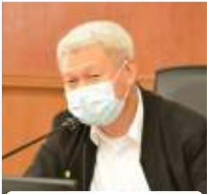
คุณปริญญญา แสงสุวรรณ

และขอแสดงความยินดีกับ คุณปริญญญา แสงสุวรรณ ลูกช้างวิศวกรรมศาสตร์ ที่ได้รับแต่งตั้งเป็นอธิบดี (นักบริหารระดับสูง) กรมท่าอากาศยาน กระทรวงคมนาคม