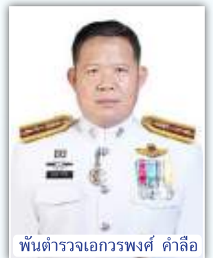
พันตำรวจเอกวรพงศ์ คำลือ

ในแวดวงข้าราชการ นักศึกษาเก่า มช. รุ่นใหม่ๆ เริ่มก้าวสู่ตำแหน่งที่สูงขึ้น เริ่มต้นจาก พันตำรวจเอก วรพงศ์ คำลือ ที่ได้รับโปรดเกล้าฯ แต่งตั้งให้ดำรงตำแหน่งผู้บังคับการสืบสวนสอบสวน ตำรวจภูธรภาค 5