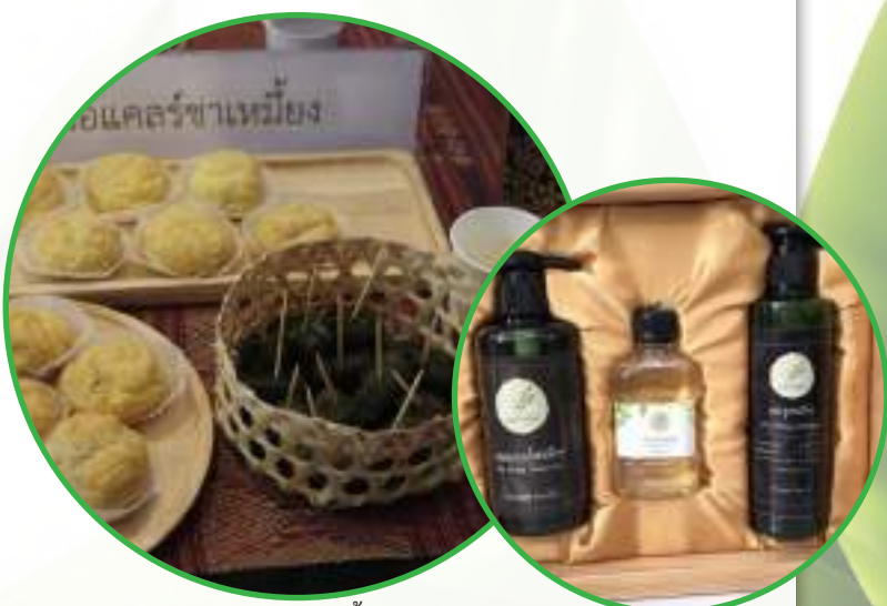
แอมพูลล์ชาเหมี้ยง

เมื่อมอง “เหมี้ยง” จากมุมใหม่ จึงไม่เห็นภาพก่อนเหมี้ยงที่หลายคนมองว่าเป็นของโบราณล้ำสมัยอีกต่อไป แต่เป็น “เหมี้ยง” ที่หมายถึง นวัตกรรมและทรัพย์สินทางปัญญาอันล้ำค่า สามารถนำมาใช้ประโยชน์ในเชิงสุขภาพและการศึกษา สร้างรายได้ และยกระดับความเป็นอยู่ของชุมชน และทำให้ “คน-ป่า-เหมี้ยง” ได้พึ่งพาอาศัยและอยู่ร่วมกันอย่างยั่งยืนโดยแท้จริง ☺