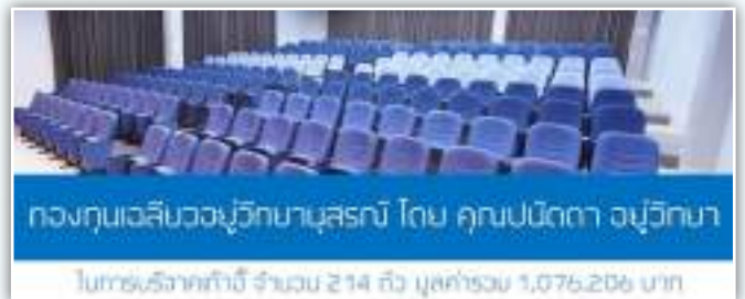
กองทุนเฉลี่ยวอัญวิทยานุสรณ์ โดย คุณปณิตดา อัญวิทยา ใบรับบริจาคเก้าอี้ จำนวน 214 ตัว มูลค่ารวม 1,076,206 บาท

ให้การสนับสนุนด้านการศึกษาอย่างต่อเนื่องสำหรับคุณปณิตดา อัญวิทยา ลูกช้างวิทยาศาสตร์ ในการบริจาคเก้าอี้ จำนวน 214 ตัว มูลค่ารวม 1,076,206 บาท ให้กับคณะวิทยาศาสตร์ โดย กองทุนเฉลี่ยวอัญวิทยานุสรณ์ ในโครงการปรับปรุงห้องบรรยาย CB2440 อาคารเคมี 2 เพื่อใช้ประโยชน์ในการเรียนการสอน ส่งเสริมสิ่งที่ดีขึ้นเรื่อยๆ ในคณะวิทยาศาสตร์ มข. มาโดยตลอด